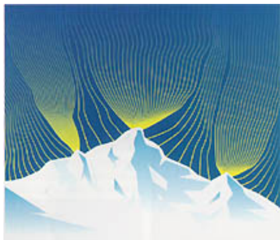
Fig. 5 - Cima di montagna con campo elettrico atmosferico immaginario (potenza di punto). Il numero di linee potrebbe corrispondere alle probabilità di subire una scarica atmosferica diretta.

Il rilevamento di punti di roccia vetrificata su cime molto esposte conferma la vulnerabilità di certi luoghi. Questi cosiddetti «folgoriti» vengono formati dalle altissime temperature sviluppate dal fulmine che provocano una metamorfosi del sasso. Inoltre anche gli oggetti con una buona conduttività elettrica saranno prediletti. L'impatto avrà luogo in particolare su torri, creste, cime, campanili, tetti di case, alberi elevati e soprattutto alberi singoli ecc. Può comunque anche accadere che una torre sia colpita dal fulmine lateralmente e non sulla cima. Il fulmine è imprevedibile.