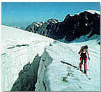
A fianco: grossi crepacci sul ghiacciaio del Scersen inferiore

Questi segni sono tipici del grado di pericolo «forte».