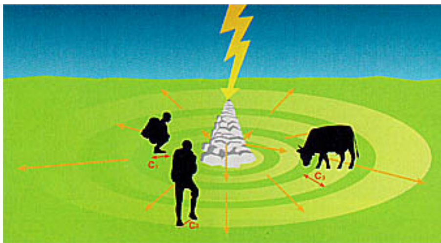
Fig. 6 - "imbuto di tensione" al suolo in prossimità di un oggetto di pietra (o qualsiasi punto del terreno) colpito dal fulmine con forte calo del potenziale in cerchi più o meno concentrici. La cosiddetta "corrente di passo" minima si verifica toccando un solo punto del terreno (corrente C1) mentre essa è maggiore per colui che è in cammino (C2). Gli animali subiscono una "corrente di passo" ancora superiore (C3) e ciò si rispecchia in un maggior numero di incidenti.

A partire dal punto d'impatto del fulmine, si formerà un campo di tensione con forte gradiente, in diminuzione verso l'esterno (Fig. 19.10). Tra un cerchio concentrico ed il prossimo, a causa dell'alta resistenza del terreno, vi è una sensibile differenza di campo elettrico. Se tocchiamo perciò due punti del terreno con tensione differente (due cerchi differenti) vi sarà della corrente che attraverserà il corpo, la tensione, o corrente di passo. Se ci appoggiamo al tronco di un singolo albero che funge da parafulmine, parte della corrente attraverserà il nostro corpo per andare a terra.