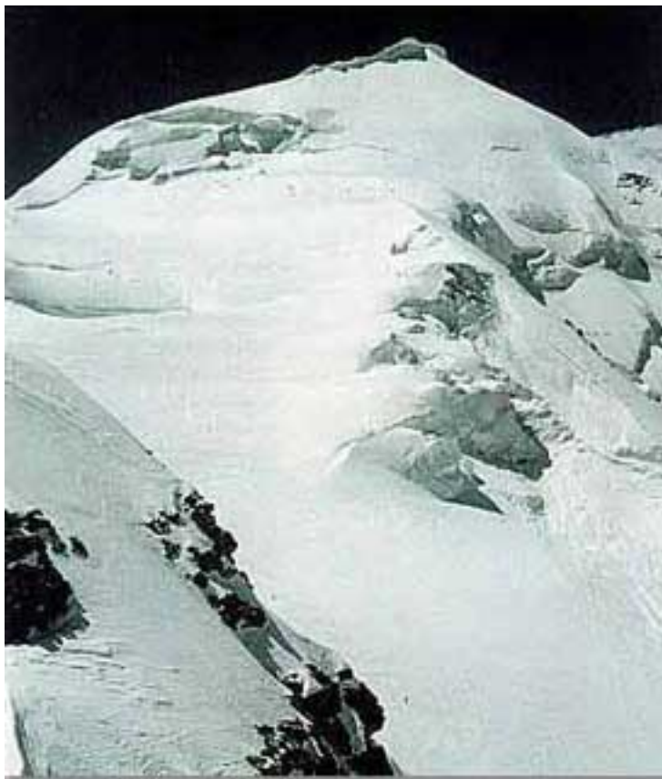
Sopra: la vetta orientale del pizzo Palùcon la sua inconfondibile cornice sommitale.